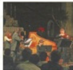
Les ateliers de musique ancienne sont des scènes de découverte de l'art baroque.

Du 11 au 17 juillet, les musiciens de la formation Orfeo di Cracovia prendront leurs quartiers d'été en vallée de la Bresle, proposant un nouveau cycle d'ateliers d'écoute et de pratique instrumentale et vocale au service de la musique ancienne, intitulé Vivant. L'initiative, en partenariat avec les conseils généraux, régionaux picards et normands et avec les villes d'Eu, Le Tréport, Aumale,