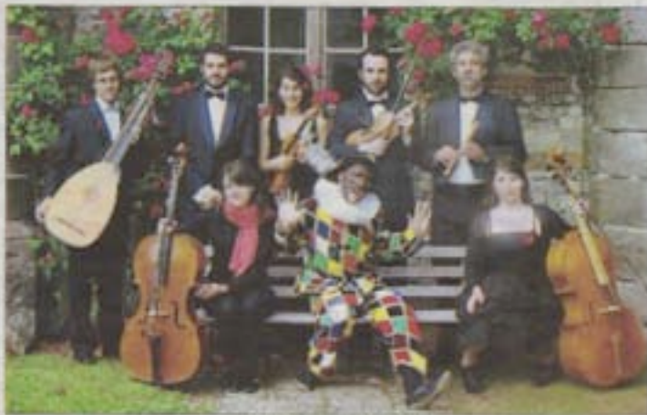
Premier rendez-vous le 12 juillet.