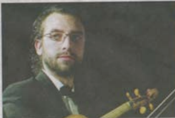
Le premier concert aura lieu le 12 juillet à Eu.

C omme chaque année depuis 12 ans, l'association des Heures Musicales de la Vallée de la Bresle vous propose ses Ateliers de Musique Ancienne. Venu des quatre coins de l'Europe, (Allemagne, Roumanie, Pologne, Espagne...), les musiciens de l'Orfeo di Cracovia prennent leurs quartiers d'été dans la Vallée de la Bresle et proposent 5 concerts du 11 au 17 juillet aux estivants entre Eu et Aumale avec quelques belles pages de Bach, Händel, Vivaldi et d'autres compositeurs des XVII e et XVIII e siècles. "Vivant..." tel est le thème choisi par l'Orfeo di Cracovia pour évoquer cette puissante source d'inspiration que représente la nature à l'époque baroque à travers la faune, la flore et le règne du vivant.