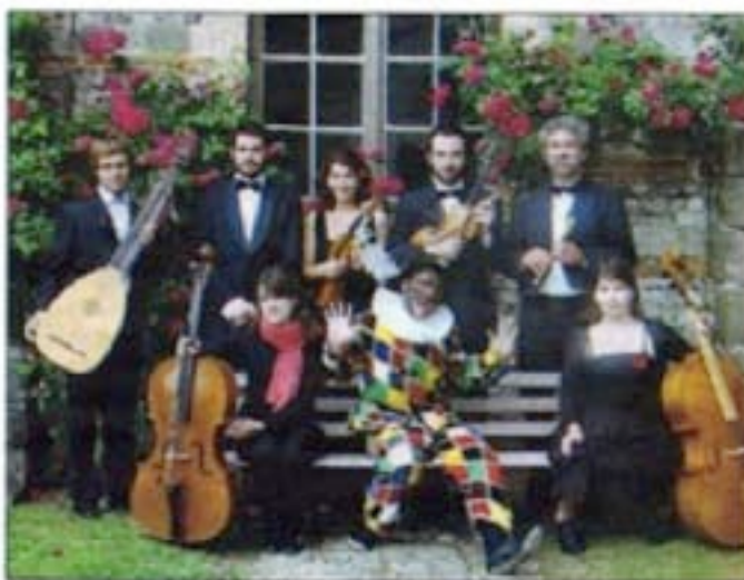
Les derniers concerts auront lieu ce week-end.

C omme chaque année depuis 12 ans, l'association des Heures Musicales de la Vallée de la Bresle vous propose ses Ateliers de Musique Ancienne. Venus des quatre coins de l'Europe, (Allemagne, Pologne, Roumanie, Espagne...), les musiciens de l'Orfeo di Cracovia prennent leurs quartiers d'été dans la Vallée de la Bresle et proposent 5 concerts du 11 au 17 Juillet aux estivants entre Eu et Aumale avec quelques belles pages de Bach, Händel, Vivaldi et d'autres compositeurs des XVIIe et XVIIIe siècles. "Vivant..." tel est le thème choisi par l'Orfeo di Cracovia pour évoquer cette puissante source d'inspiration que représente la nature à l'époque baroque à travers la faune, la flore et le règne du vivant.