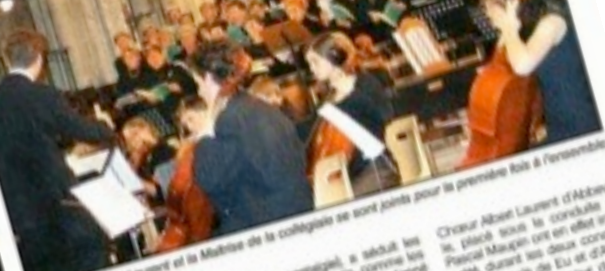
Le Chœur Albert Laurent et la Maîtrise de la collégiale se sont joints pour la première fois à l'ensemble Ostinato