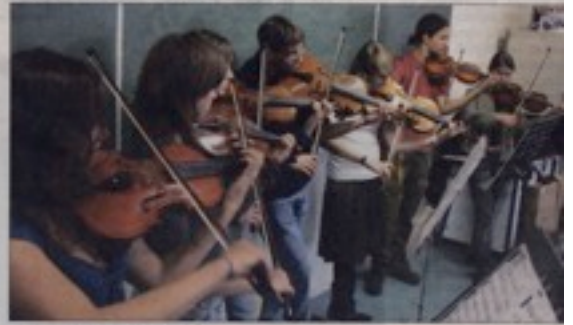
Ostinato, jeune orchestre de Cracovie, a été accueilli au collège.