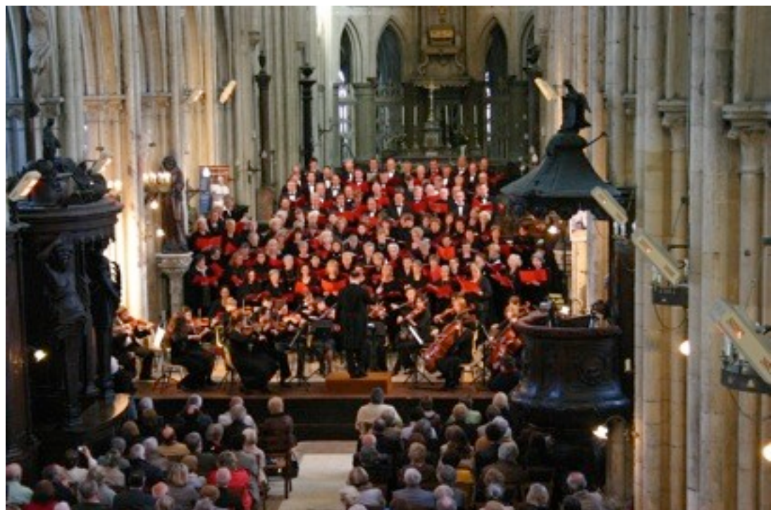
OSTINATO en concert avec les chorales d'Eu, Abbeville, Dieppe à la Collégiale d'Eu Mars 2010

Mercredi 18 Avril Collège de Ponthieu ABBEVILLE