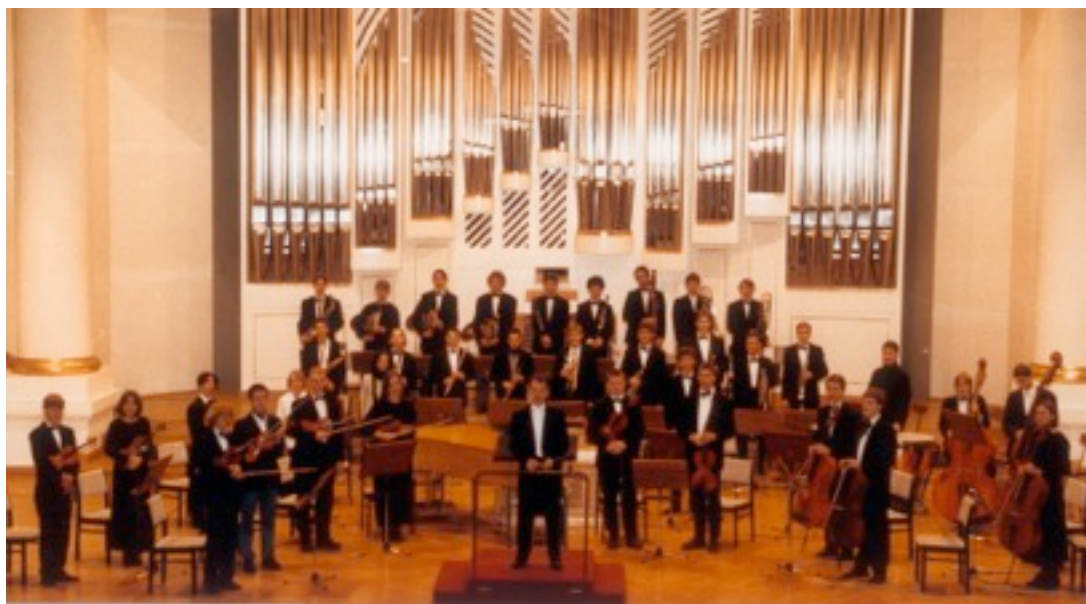
OSTINATO en concert dans le grande salle de la Philharmonie de Cracovie