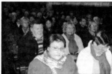
Un public passionné et attentif