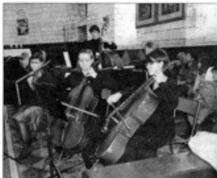
Une partie des jeunes musiciens pendant le concert